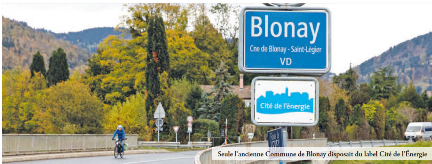
Seule l'ancienne Commune de Blonay disposait du label Cité de l'Énergie

ÉNERGIE - Les mesures prises pour faire face à une éventuelle pénurie s'inscrivent en parallèle aux efforts menés par les autorités pour instaurer une politique énergétique et climatique communale sur le long terme.