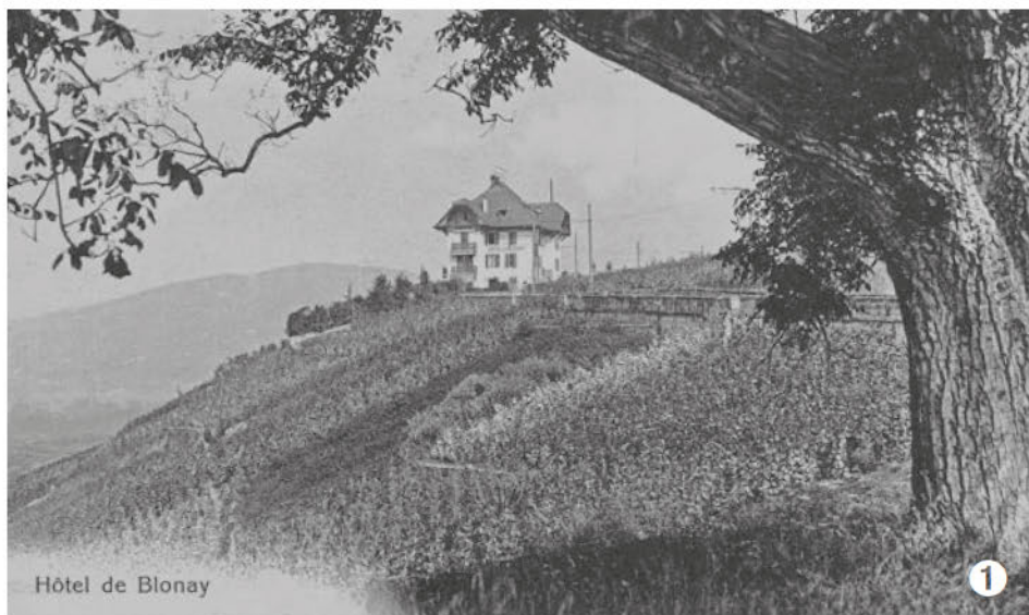
Hôtel de Blonay

HISTOIRE - Les archives communales recèlent des trésors quant à l'histoire et aux traditions des habitantes et habitants de Blonay-St-Légier et la Chiésaz. L'occasion dans ce numéro de s'immerger dans une partie de notre passé. D'ailleurs, sauriez-vous reconnaître où ont été prises les différentes photos ci-dessous et à quels bâtiments elles correspondent aujourd'hui ? Une sélection de Gianni Ghiringhelli, archiviste historien pour la commune.