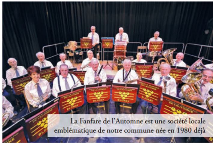
La Fanfare de l'Automne est une société locale emblématique de notre commune née en 1980 déjà

Aujourd'hui, nous sommes 25 musiciens d'une moyenne d'âge de 74 ans contre une trentaine avant la crise sanitaire. Certains membres nous ont quittés. Trois sont malheureusement décédés. Heureusement, d'autres nous ont rejoints. Beaucoup sont de la région, mais l'on compte aussi des personnes qui viennent d'Aigle, de la Veveyse et même d'Orbe. Il y a une majorité de cuivres et des instruments dits de bois (clarinette, saxophone). Nous interprétons un répertoire