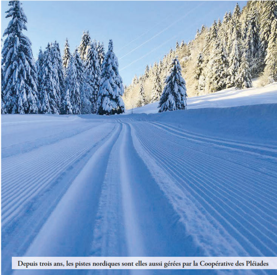
Depuis trois ans, les pistes nordiques sont elles aussi gérées par la Coopérative des Pléiades