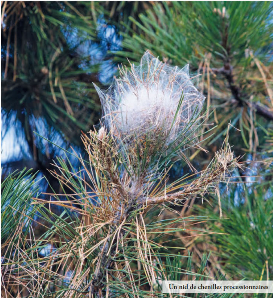
Un nid de chenilles processionnaires

Tout le monde aime les papillons, mais avant de prendre leur envol, ces insectes passent par le stade de chenilles. Sur l'arc lémanique, depuis plus de dix ans désormais, une espèce urticante pullule dans les pins. Appelées processionnaires du pin, elles ne sont pas les bienvenues. Un arrêté cantonal impose d'ailleurs à tous les propriétaires d'un arbre colonisé d'éradiquer les nids d'ici au 30 janvier. Mais pourquoi tant de hargne envers ces bestioles ?