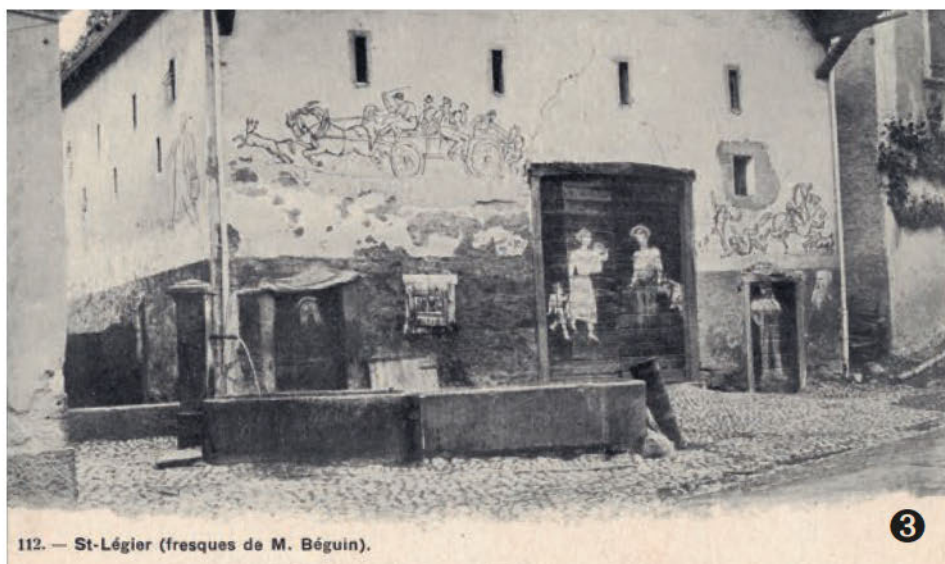
112. — St-Légier (fresques de M. Béguin).

Cette maison, dont la photo a été faite en 1922, n'existe plus. Elle se trouvait à côté de la pharmacie de Saint-Légier. On y voit sur sa façade des dessins réalisés par l'artiste Alfred Béguin, dont on peut encore admirer les caricatures sur les façades de certaines maisons vigneronnes du village. La fontaine est la seule pièce encore visible aujourd'hui, bien qu'elle n'ait plus de bassin.