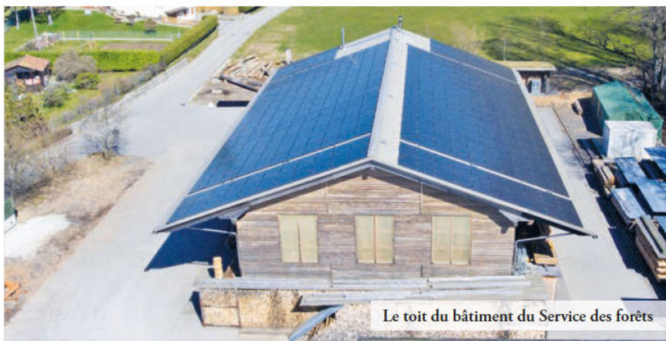
Le toit du bâtiment du Service des forêts