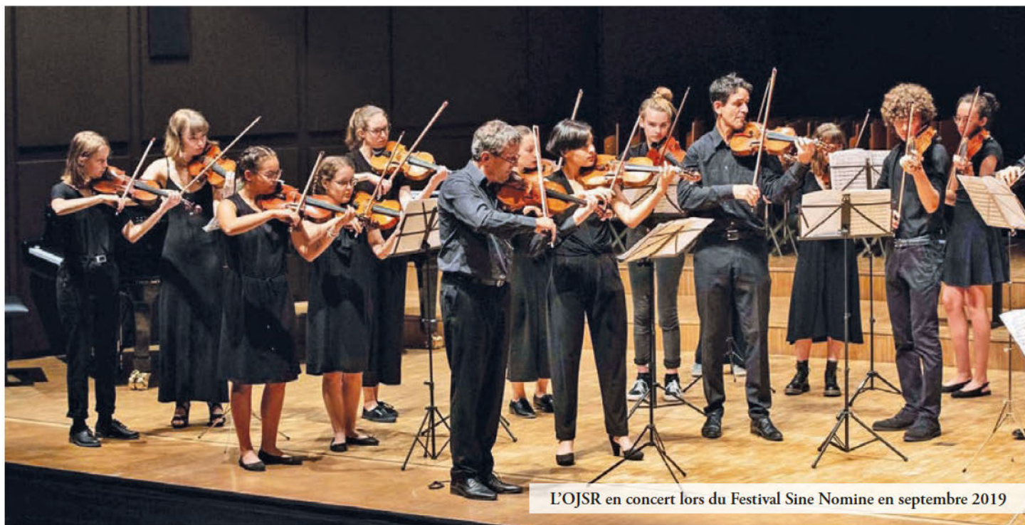
L'OJSR en concert lors du Festival Sine Nomine en septembre 2019

Le dimanche 11 décembre prochain à 16h, l'Orchestre des Jeunes de Suisse Romande (OJSR) donnera son traditionnel concert de Noël à l'Aula de Bahyse. Cela fait maintenant dix ans que l'évènement a vu le jour. Il a lieu en alternance à Saint-Légier et Blonay. L'entrée est libre mais une collecte en faveur de l'orchestre est organisée à la fin. Aucune réservation n'est nécessaire.