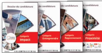
Dossiers de candidature des 4 Mérites

Au terme du délai de candidature, fixé le 30 avril 2020, les dossiers seront soumis à deux jurys distincts. En parallèle, deux comités experts parcourront l'ensemble des dossiers reçus afin de distinguer une entreprise dans le domaine du développement durable ainsi qu'une femme dirigeante/entrepreneuse :